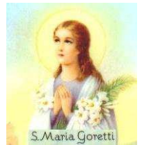
S. Maria Goretti

partenza per CORINALDO, definito dallo scrittore Mario Carafoli in uno dei suoi saggi come il paese più bello del mondo. Corinaldo, dall'impronta urbana medioevale e rinascimentale, possiede le mura di difesa meglio conservate e più suggestive della regione. Quasi un chilometro (900 metri circa) di fortificazioni intervallate da porte bastionate, baluardi poligonali, torrioni circolari e pentagonali e torri di guardia... Le mura risalgono originariamente al 1367 ma vennero ampliate tra il 1484 e il 1490 dall'architetto Martini che le estese, portandole al perimetro attuale. Queste mura sono il monumento più importante della città al quale si aggiungono chiese, palazzi ed altre opere. Tra l'altro Corinaldo è anche il paese natale di Maria Goretti (1890-1902). Pranzo in ristorante a Marotta con menu di pesce. Al termine, tempo permettendo, passeggiata sul lungomare e rientro